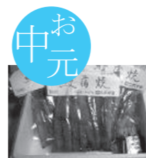
鰻蒲焼き真空パック3袋 セット6,000円です。

〒500-8474 岐阜市加納本町 2-17 TEL : 058-271-7843 FAX : 058-275-0404 http://www.7a.biglobe.ne.jp/~nimonziya/ E-mail : nimonziya@yahoo.co.jp