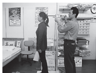
全身測定中。丁寧な測定がオリジナル を作るポイント!

あなたの体型を測定 し、世界で1つの、あな たのための「オーダー 枕」をお作りします。 買った後も安心! 1年間、無料で高さの 調節をいたします。