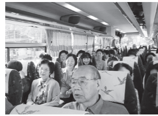
生命共済加入者バスツアー