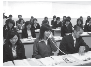
フレッシュ社員セミナー