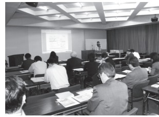
適格退職年金移行セミナー