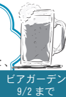
ビアガーデン 9/2 まで

今年もどうぞ。 金華山頂ビアガーデン！ きらめく光の世界。 仲間と、家族と、大切な人と、 乾杯しませんか？