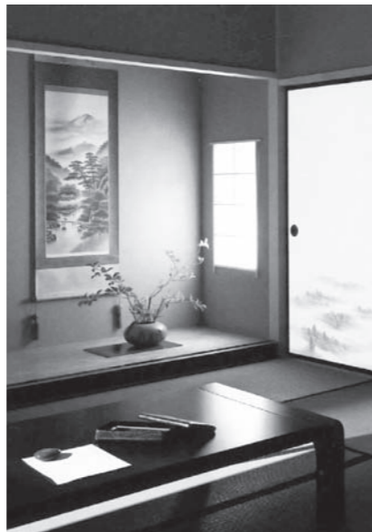
お部屋の改装に依り雰囲気満点となります。

お客様の大切なお部屋の空間のイメージ転換のためお推めします。襖の新柄張替え、また、お部屋の装飾品、掛軸、額装など調度品