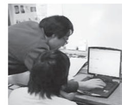
持ち込みも大歓迎! 今ある機材で

〒502-0812 岐阜市八代 2-4-12-102 TEL : 058-233-1794 URL : www.mirai.ne.jp/~espac e-mail : espac358@he.mirai.ne.jp