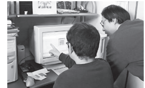
ワンツーマンでの指導で納得いくまで

まずは、 無料カウンセリングであなたのご希望・ご要望を伺います。不明な点は、お問い合わせをして下さい。親切なスタッフがご回答させていただきます。