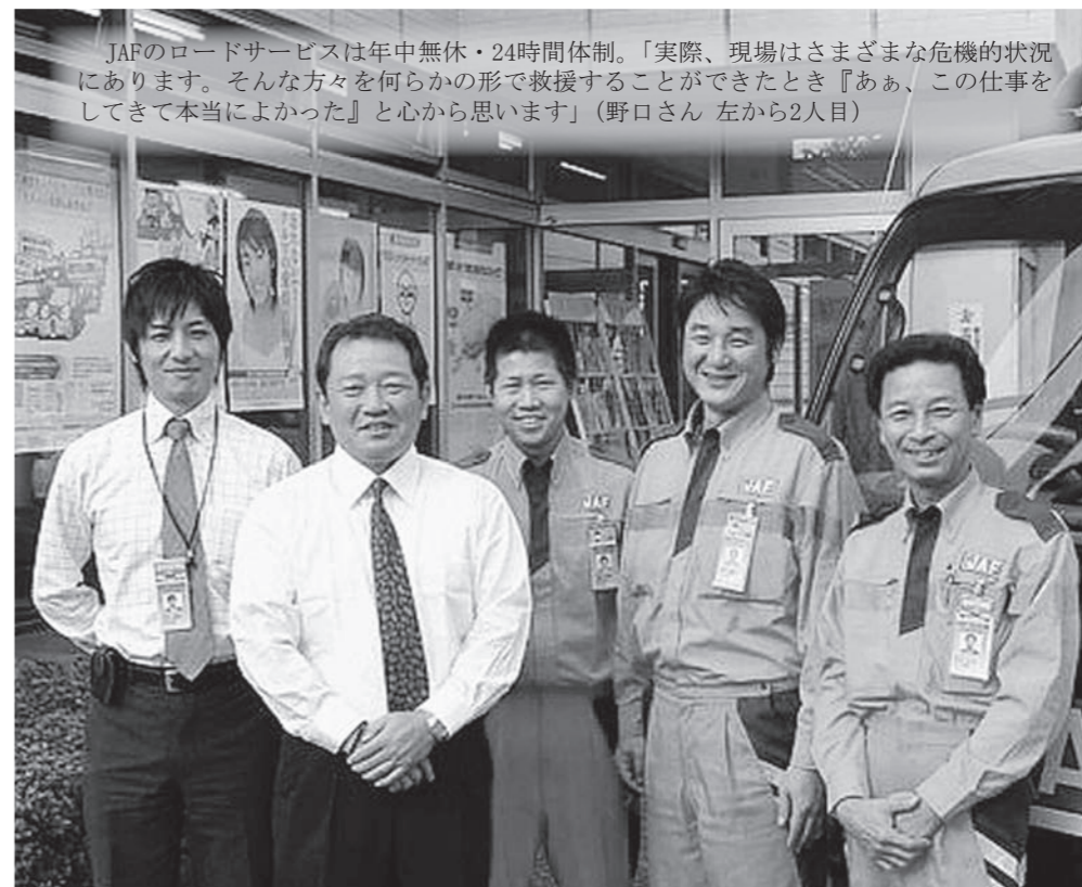
JAFのロードサービスは年中無休・24時間体制。「実際、現場はさまざまな危機的状況にあります。そんな方々を何らかの形で救援することができたとき『ああ、この仕事をしてきて本当によかった』と心から思います」(野口さん 左から2人目)