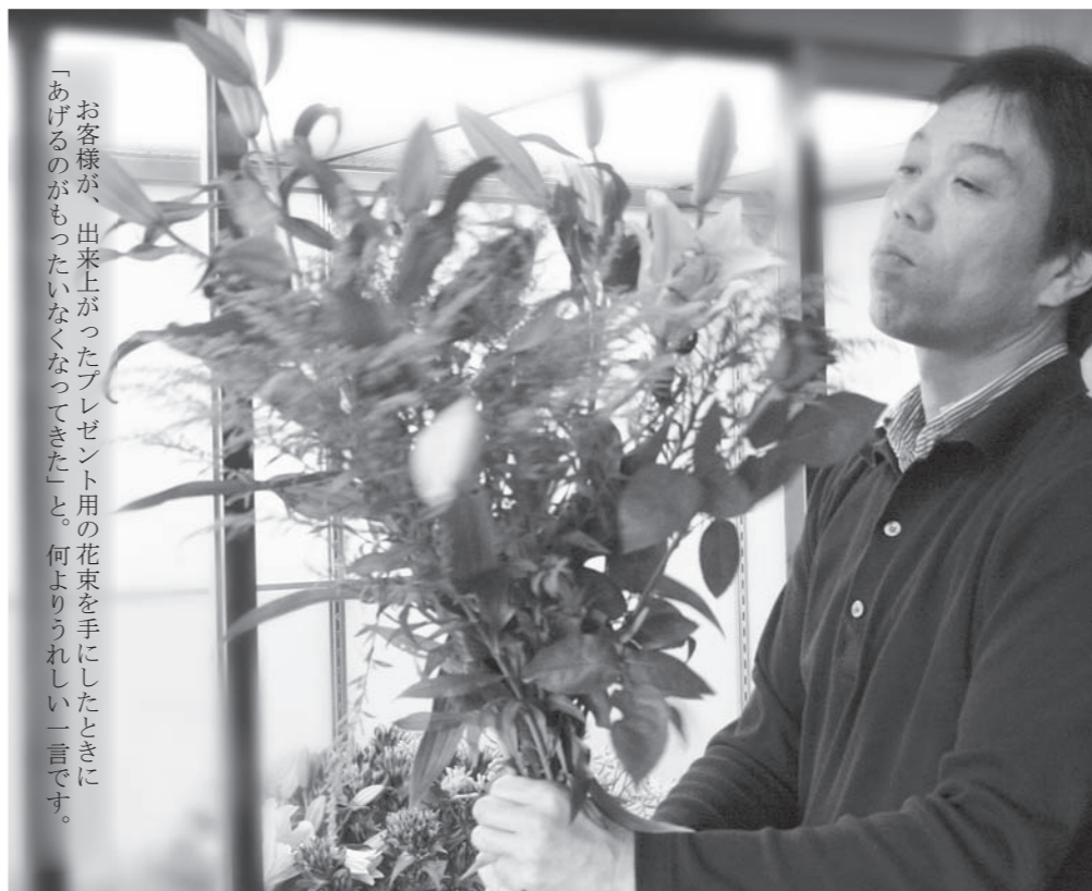
お客様が、出来上がったプレゼント用の花束を手にしたときに「あげるのもったいなくなってきた」と。何よりうれしい一言です。