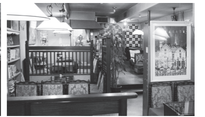
昭和48年開業で、ノスタルジーあふれる店内。