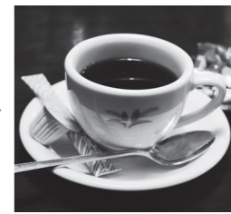
煎れたてのコーヒー 400円。