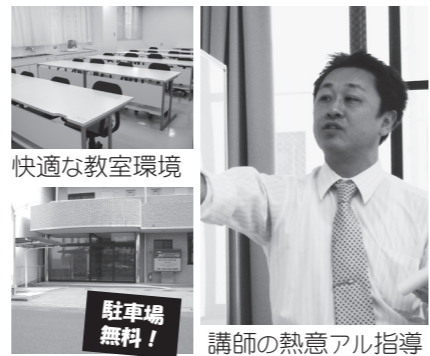
快適な教室環境 講師の熱意アル指導