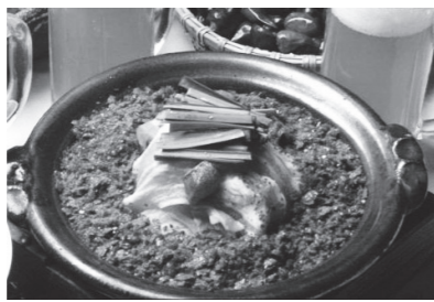
地獄鍋 530 円 カブサイジンをたっぷりどうぞ!

住 岐阜市橋本町 1-10 JR 岐阜駅アスティ 1F TEL 058-263-0682 E-mail katake0310@yahoo.co.jp 営 無休 11:30 ~ 23:00