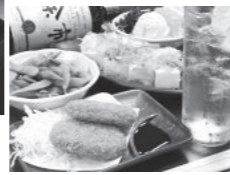
ハイボールセット 500 円 ハイボール+おつまみ一品 (枝豆・そら豆・冷奴・メンチカツ・ポテトサラダから一品)! ワンコインで気軽に楽しめる!