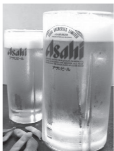
メガジョッキ 780 円!