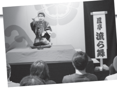
▲川原町ふきのとう寄席