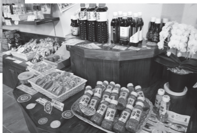
店内には数多くの話題の商品が並び

こともありませんが、開発に向けて着実にすすめています。応援センターとしても、ファンド申請までで支援を終了するというわけではなく、今後も引き続き連携先との調整や販路開拓などの支援をしていく予定です。