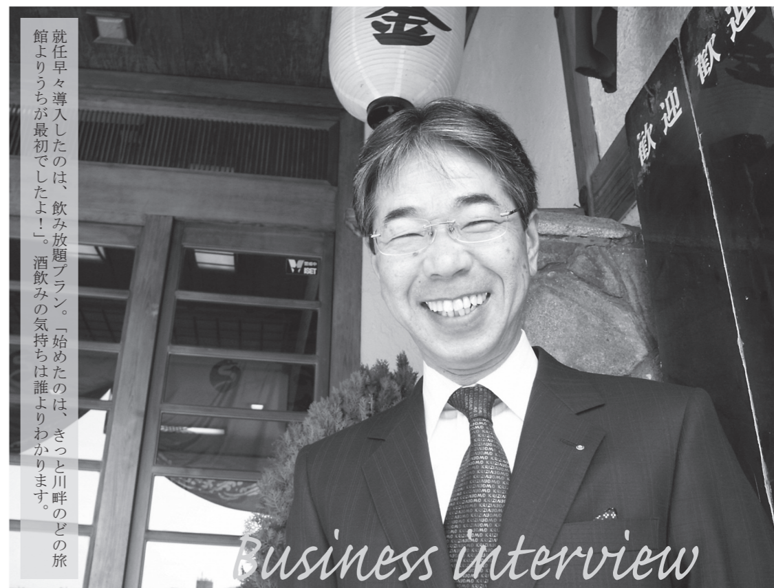
就任早々導入したのは、飲み放題プラン。「始めたのは、きっと川畔のどの旅館よりうちが最初でしたよ!」。酒飲みの気持ちは誰よりわかります。