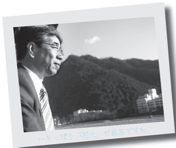
…やっぱり「花火」が最高ですわ。

「贅沢すぎますよ」この窓から眺める四季折々の風景。言葉にはならない感動が、すぐ目の前に広がります。