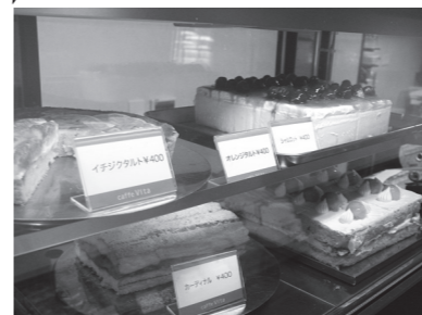
1つ1つ、心をこめて、手作り。