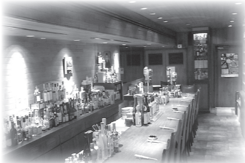
1Fはカウンター15席とボックス席