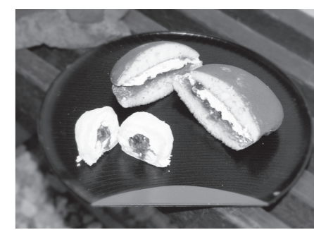
「クリーム餅」(105円) 「生クリームどら焼き」(5個入・1,000円)

生クリームと粒あんの 「ハーマニー」 とろろり「クリーム餅」はフワフワのお餅に包ま れた、生クリームと上品な甘さの粒あん。絶妙な ハーマニーが大人気! くせになる味!「生 クリームどら焼き」 は、しっとりしたカ ステラ生地、ぎっ しりとはさまれた粒 あん&生クリームの やさしい調和。 おやつにも、お土産 にも是非ご利用く ださいませ。