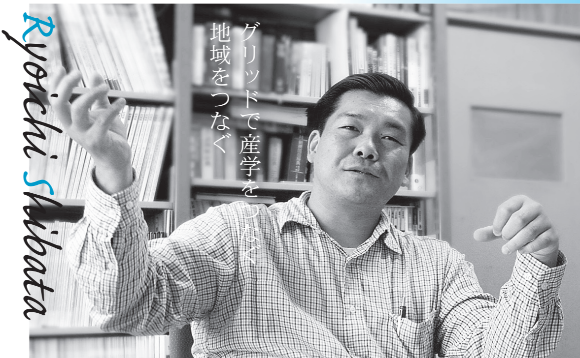
岐阜工業高等専門学校・建築学科

本コーナーは、岐阜市近郊の大学研究者を中心に「自身のエピソードや岐阜への思いを語っていただく」とともに、連携できる内容を紹介し、読者との橋渡しを目指しています。