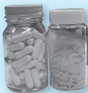
最新がん予防サプリメント

今後はこのキサントンを「パナキサントン」として商標登録し、がん治療のサポーター、ドクターサプリメント（医者）の指導で服用できる健康食品として広めたいと考えています。