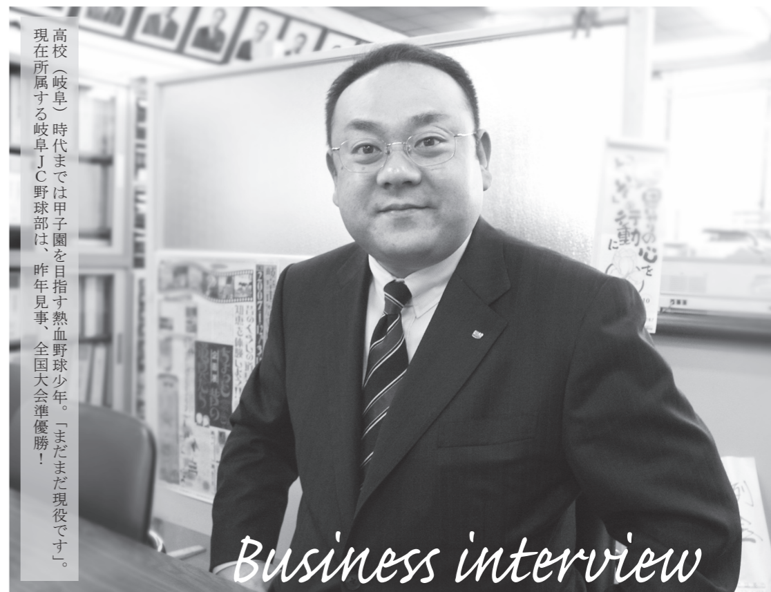
高校（岐阜）時代までは甲子園を目指す熱血野球少年。「まだまだ現役です」。現在所属する岐阜J.C.野球部は、昨年見事、全国大会準優勝！