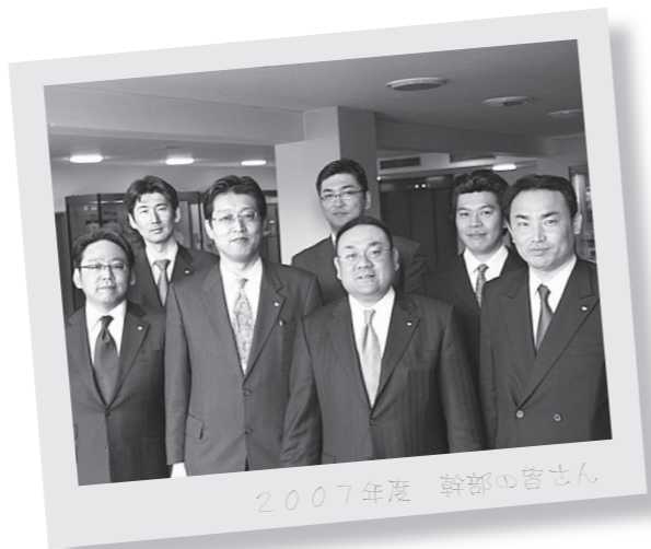
「一緒に活動しましょう！」若手経済人が増えていくことが岐阜の経済活性化につながります。只今会員募集中。

家業（早川バルブ製作所）では昨年12月、代表取締役社長に就任。社員、家族、多方面からの「がんばれ」という心強い声援に支えられる毎日です。