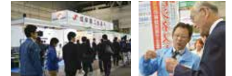
来場者や出展企業との交流・PRも盛んに行われています。