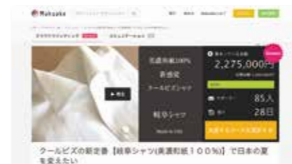
クラウドファンディング「Makuake」ホームページ

岐阜の代表的な地場産業である繊維産業の生産流通経路は長良川流域に沿って存在しています。当所では、その特徴を活かした「岐阜シャツ」の企画、開発に取り組んでいます。