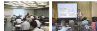
経営一般セミナー

創業・起業を促す環境作りや、中小企業の新商品・新技術の開発などの経営革新を促進・支援しています。