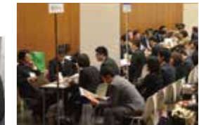
売り込み! 商談マーケット