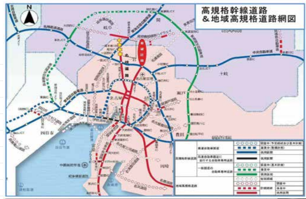
当日資料より抜粋