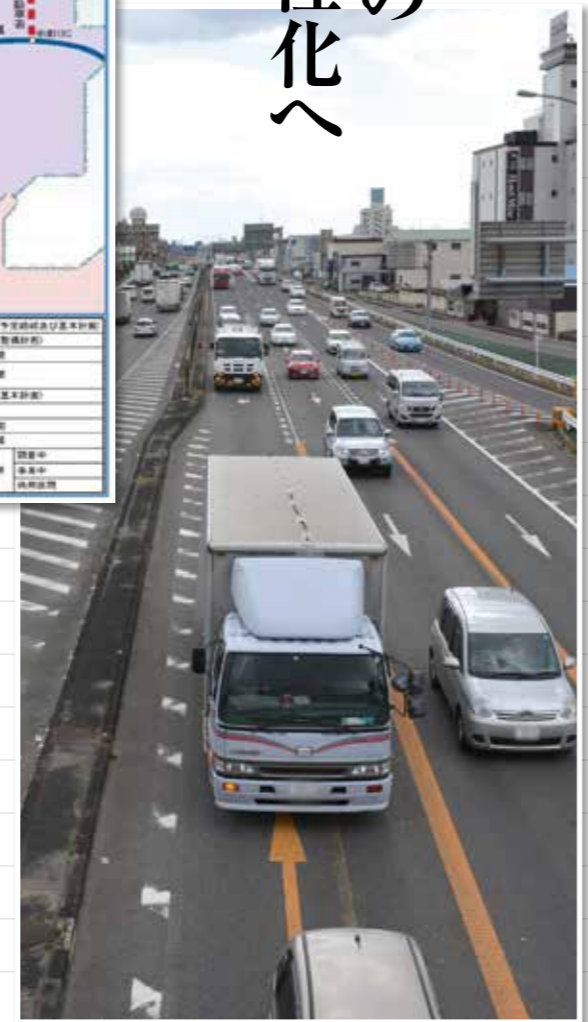
一宮木曾川IC～岐南IC区間