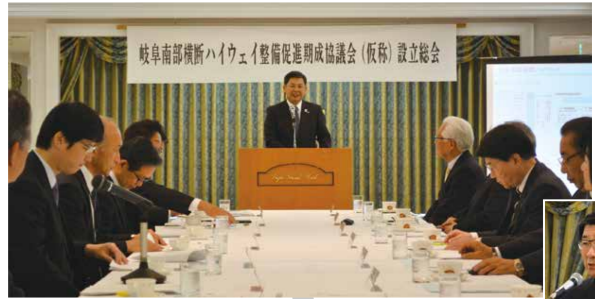
平成29年3月23日(木) 岐阜グランドホテルにて