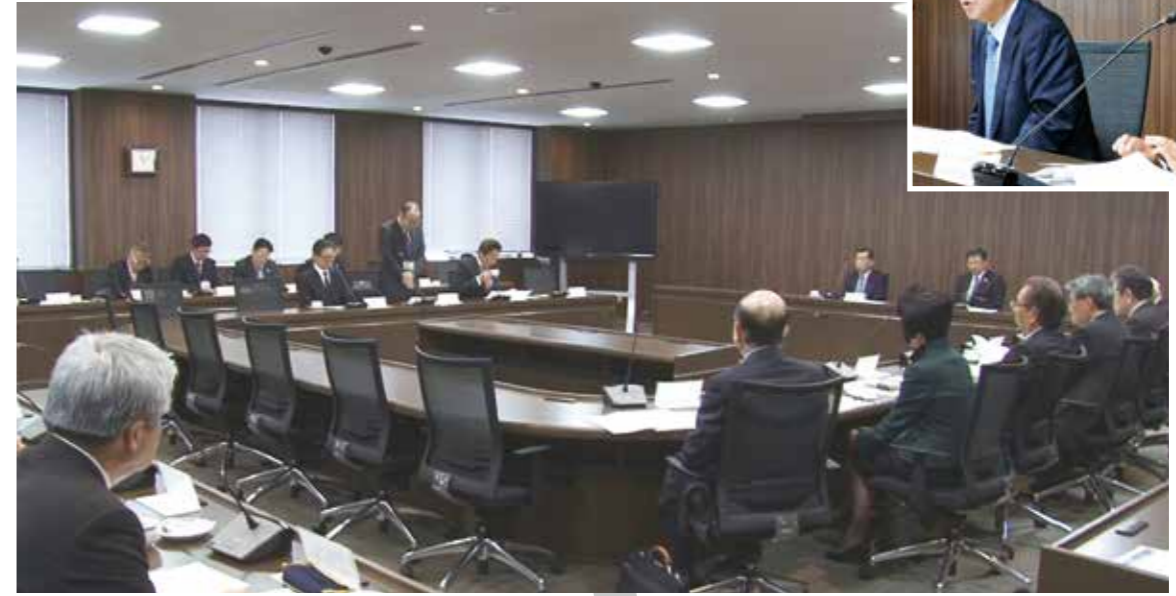
平成29年3月23日(木) 一宮商工会議所にて