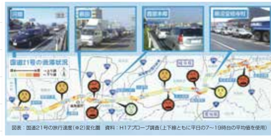
当日資料より抜粋

4市を結ぶ唯一の東西幹線である国道21号は、交通量が集中し、朝夕に渋滞が発生しています。