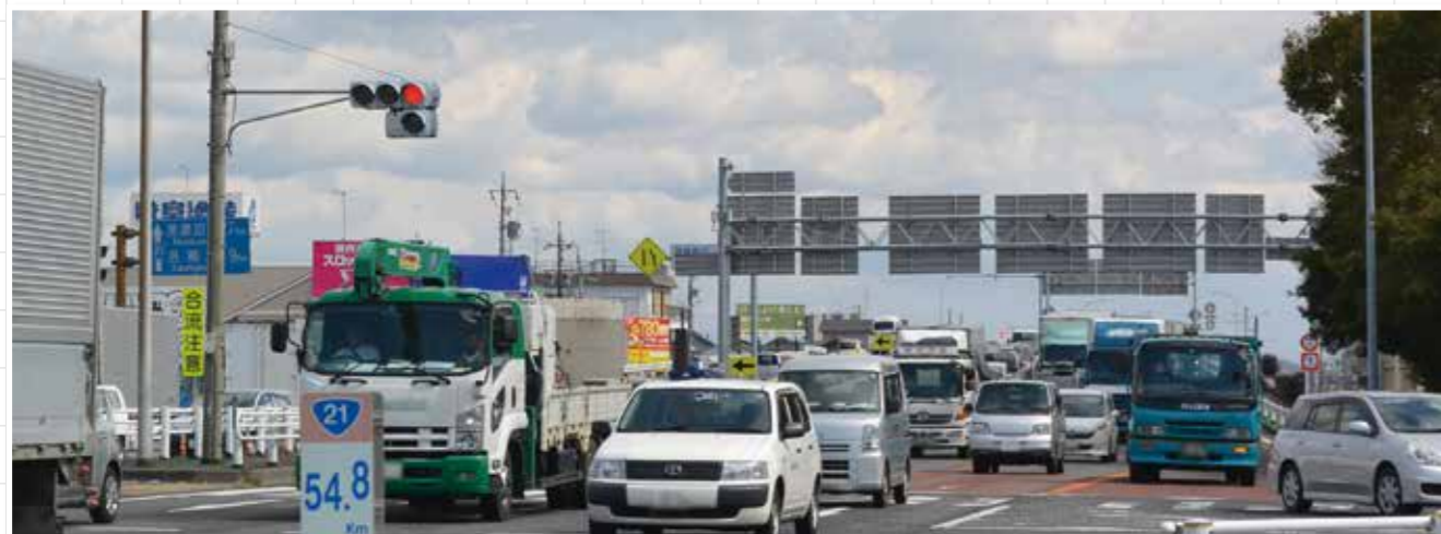
朝夕の渋滞発生や、交通事故が多発している交差点のひとつ西部本郷

岐阜商工会議所をはじめとする10商工会議所・商工会では、去る3月23日「岐阜南部横断ハイウェイ整備促進期成協議会」を設立しました。 この協議会は、大垣市から美濃加茂市の東西約40キロを結ぶ「岐阜南部横断ハイウェイ」の早期完成に向け、国などへの積極的な要望活動を行うなどの働き掛けを強化することを目的に設立しました。 この「岐阜南部横断ハイウェイ」は、昭和30年代に事業が始まり、現在国道21号坂祝バイパスなど一部で供用が始まっているものの、調査区間、計画路線の指定のまま建設が停滞している区間もあるなど、半分以上が未着工となっている地域高規格道路です。 協議会では今後、岐阜市など関係市町でつくる「国道21号・22号及び岐阜南部横断ハイウェイ整備促進期成同盟会」と連携・協力しつつ、採択した決議文をもとに関係各方面に対し早期完成を強く要望してまいります。