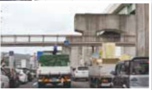
名岐道路一宮中入口周辺