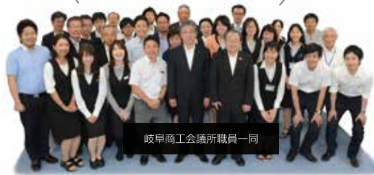
岐阜商工会議所職員一同

入会資格 岐阜市内で6か月以上営業されている商工業者なら、規模・業種を問わず、どなたでも加入できます。