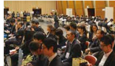
売り込み! 商談マーケット

中小企業者が大手企業のニーズに対して自社の製品や技術をPRする商談会です。大手バイヤーに対し、エントリーした多くの中小企業がプレゼンテーションを行います。