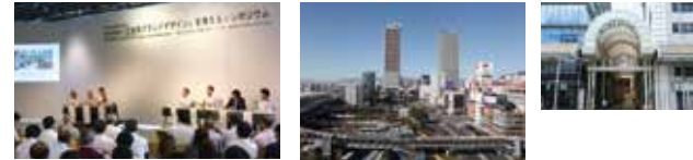
岐阜市中心市街地の「近未来のランドデザイン」を考えるシンポジウム