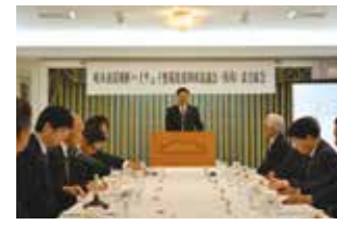
岐阜南部横断ハイウェイ整備促進期成協議会設立総会 (平成29年3月23日 岐阜ランドホテルにて)

地場産業や中小企業の発展にとって重要な社会基盤の整備を促進するため、陳情・要望促進活動などを活発に展開しています。