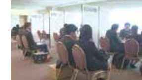
売り込みビジネス商談会