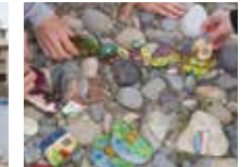
宝探し・ストーンペイント