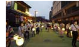
川原町から出発/提灯行列