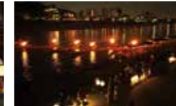
長良川フロムナードにて鶴鶴を観覧