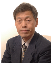
公益財団法人ソフトピアジャパン 理事長