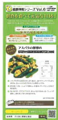
〈健康情報リーフレット〉