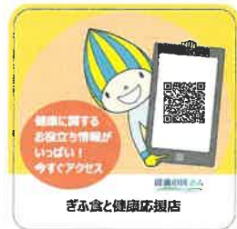
〈QRコード付きステッカー〉