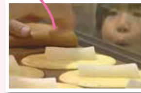
鮎菓子実演コーナー