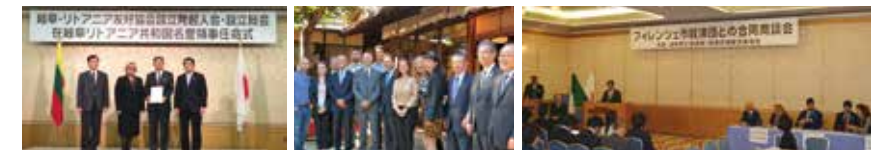
在岐阜リトアニア共和国名誉領事任命式 フィレンツェ市からの訪問団 フィレンツェ市経済団との合同商談会