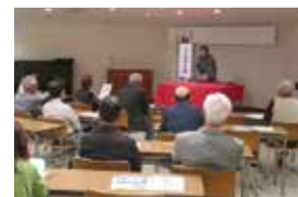
落語で学ぶ相続・事業承継セミナー