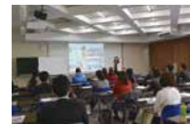
販売促進セミナー

販路開拓、事業承継、税金、法律等様々な内容のセミナーを年間20~30回ほど開催します。