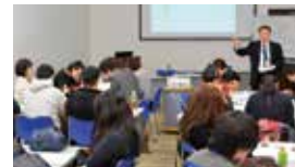
夢を叶える創業スクール in GIFU

創業セミナーの開催。創業に際して必要な税法、融資、事業計画について、数回の講座に分けて学びます。