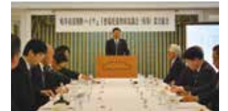
岐阜南部横断ハイウェイ整備促進期成協議会 設立総会

中小企業の発展や地場産業の活性化にとって、重要な社会基盤の整備を促進するため、陳情・要望活動を行っています。