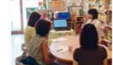
まちゼミ「おしえ店長サン」