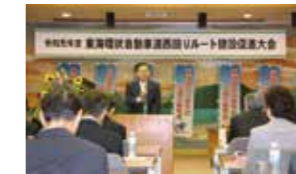
令和元年度 東海環状自動車道西回りルートの建設促進大会