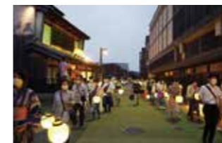
川原町から出発/提灯行列