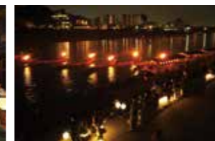
長良川プロムナードにて鵜飼を観覧