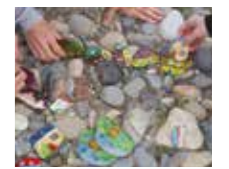
宝探し・ストーンペイント