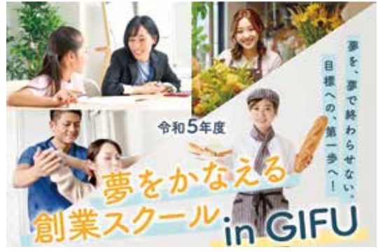
「創業スクール」では、全8回に渡って創業に関するあらゆる知識やノウハウを網羅的に学ぶことができる

ートアップ予備軍が参加している。今年度の創業スクールは9月から開始、募集定員30名があつという間に達するなど、岐阜市でも起業創業の熱は高まりつつある。また、今年度からは、「起業家交流会」を岐阜市・岐阜県よろず支援拠点と合同で開催する予定なので、どのような起業家やベンチャー企業が参加しているか岐阜商工会議所に尋ねてみるのもいいかもしれない。