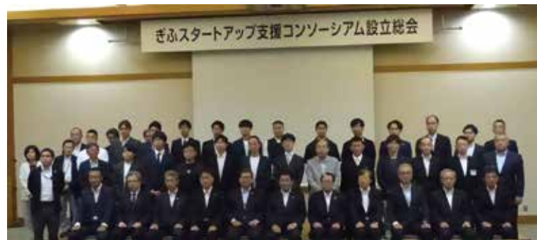
6月8日に「ぎふスタートアップ支援コンソーシアム」の設立総会が開催された

支援ができる体制を作り、昨年度からは「岐阜市スタートアップ支援補助金」を設けている（上限額500万円／採択件数2件程度）。こうした取り組みを通じて、岐阜市には徐々にスタートアップが現れるようになってきた。岸田政権が「スタートアップ創出元年」と位置づけ、「スタートアップ育成5か年計画」を発表したのは昨年2022年のこと。その波が地方である岐阜にも確実に来ている。