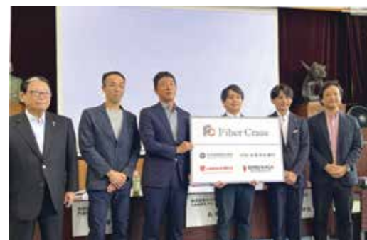
FiberCrazeの資金調達に関する記者発表の様子

その背景としてあるのは、地方の中堅・中小企業を取り巻く環境だ。少子高齢化、デジタル化、グローバル化によってますます多様化・複雑化していく顧客ニーズ、昨今の物価高騰や急激な円安など加速度的に変化していく社会経済情勢、こうした環境下で同じ技術・同じやり方を続けている企業は、生き残ることが相当難しいと思われる。これらに柔軟に対応しながら、自ら新たな価値を創造し新たなマーケットを作り出す必要がある。いわゆる「イノベーション」であるが、人手不足がますます深刻化する中、地方の中堅・中小企業にイノベーションを起こせる人材が十分いるだろうか。育てている余裕があるだろうか。ここに「企業の成長曲線」の図がある。あなたの企業が現在どのステージにいるのか、客観的に振り返っていただきたい。もし安定期や衰退期にあつて、社内でのイノベーションが難しい場合は、岐阜のスタートアップに目を向けてみてはどうだろうか。