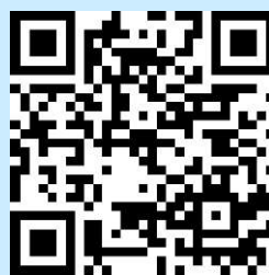
参加申込みフォーム

* 二次元コードを読み取り、参加申込みフォームに必要事項を記入して登録してください。